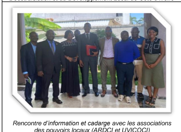
Rencontre d'information et cadrage avec les associations des pouvoirs locaux (ARDCI et UVICOCI)