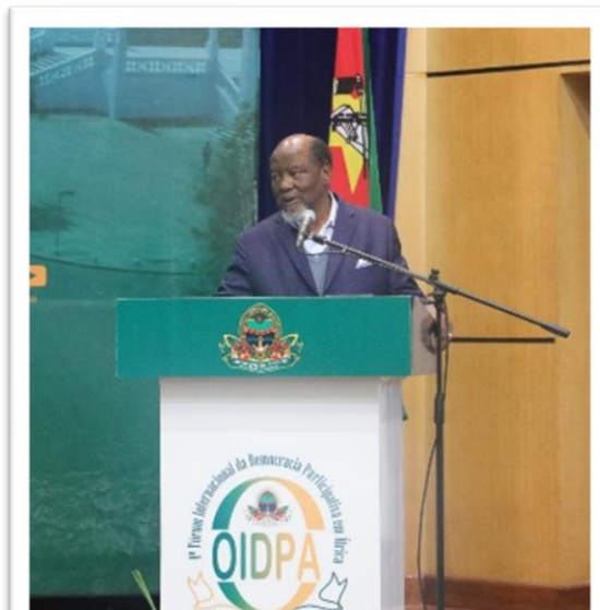
SEM Joachim CHISSANO, ancien Président de Mozambique