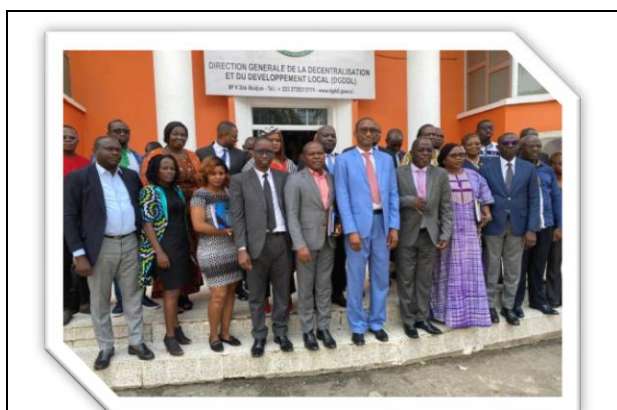
Rencontre de cadrage avec la Direction Générale de la Décentralisation et du Développement Local de Côte d'Ivoire

l'engagement 1 du 4e Plan d'Action National du Partenariat pour le Gouvernement Ouvert, appuyé par le PAGOF.