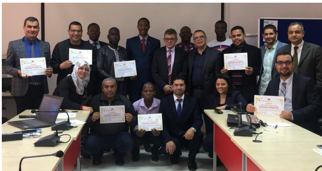
Illustration 16 : Photo de famille formation DEL - Tunisie

Elle a été organisée par Enda ECOPOP en partenariat avec le Centre de Formation et d'Appui à la Décentralisation (CFAD de Tunisie), l'Académie des Collectivités Locales de Cités et Gouvernements Locaux Unis d'Afrique (ALGA/CGLU Afrique), l'Observatoire International de la Démocratie Participative (OIDP Espagne) et avec l'appui scientifique de Onu HABITAT et ECOPLAN (Canada) qui ont produit les supports didactiques objet de la formation.