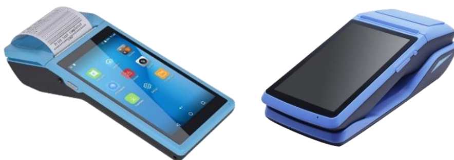
Illustration 1 : Aperçu du dispositif Ytax

Depuis le 1 er janvier 2021, le dispositif est expérimenté dans 4 communes du Sénégal : Bagadadji, Kédougou, Koumpentoum et Tanaff. Au bout de trois (3) mois de mise en œuvre, YTAX a permis de booster le recouvrement des taxes, qui s'est traduit par une hausse globale de la collecte dans toutes les communes. Ci-dessous le tableau d'évolution de la collecte par rapport à l'exercice précédent (en raison de la survenue de la pandémie de Covid-19 en 2020, l'année 2019 a été prise comme année de référence).