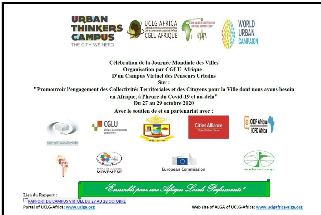
Illustration 9 : Flyer sur le Campus Virtuel

Collectivités Territoriales et des Citoyens pour la Ville dont nous avons besoin en Afrique, à l'heure du Covid-19 et au-delà". Cette activité a été réalisée en partenariat et avec l'appui de plusieurs autres partenaires dont: UNDESA, ONU-Habitat, Cities Alliance, UNESCO, ICESCO, la Ville de Rabat, le Conseil Régional du Tourisme de la Région de Rabat-Salé Kénitra, Fondation Romulato Del Bianco, Life Beyond Tourism de Florence. Le Jour de l'action a été dédié à la Culture et au Patrimoine dans le contexte de la pandémie du Covid-19 et ce, en coordination avec le Programme Capitales Africaines de la Culture (CAC) de CGLU-Afrique et la Ville de Rabat.