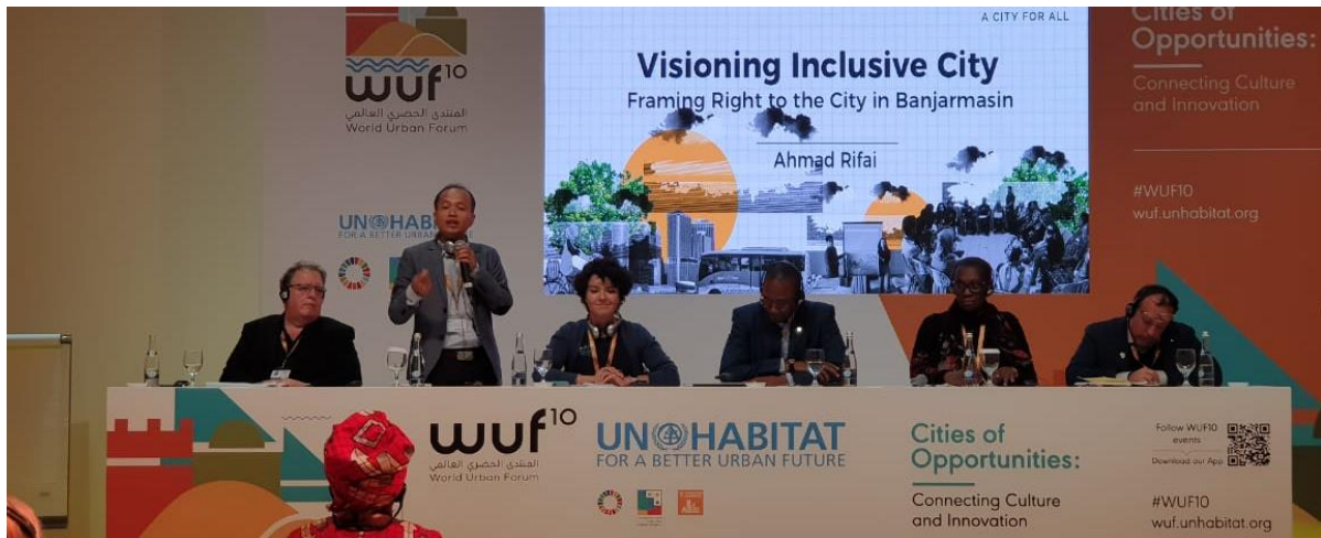
Illustration 7 : Session sur les Pratiques participatives et droit à la ville au cœur de l'innovation urbaine