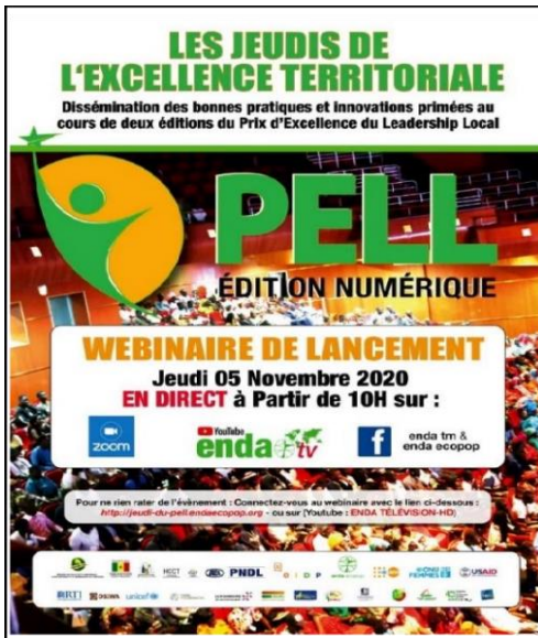
Illustration 2: Flyer du Lancement de la 3 e Edition du PELL

La troisième édition du Prix d'Excellence du Leadership Local (PELL 2020), tenue sous un format numérique, vu le contexte de la pandémie du COVID 19, a été lancée le 05 novembre 2020 sur la plateforme de vidéoconférence Zoom, par Enda ECOPOP en collaboration avec l'Union des Associations des Elus Locaux (UAEL), le Programme National de Développement Local (PNDL) et l'Observatoire International de la Démocratie Participative (OIDP Afrique) sous l'ancrage institutionnel du Ministère des Collectivités Territoriales, du Développement et de l'Aménagement des territoires (MCTDAT).