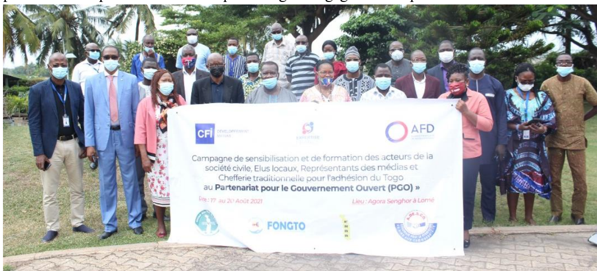
Illustration 21 : Photo de famille Atelier de Formation au Plaidoyer pour l'Adhésion du Togo au PGO

A l'issue de cette session de renforcement de capacités, il est retenu en perspective de mettre en place un comité de lobbying et de plaidoyer qui ira vers l'administration et ciblera les personnes clés pour faire en sorte que le Togo s'engage dans ce processus.