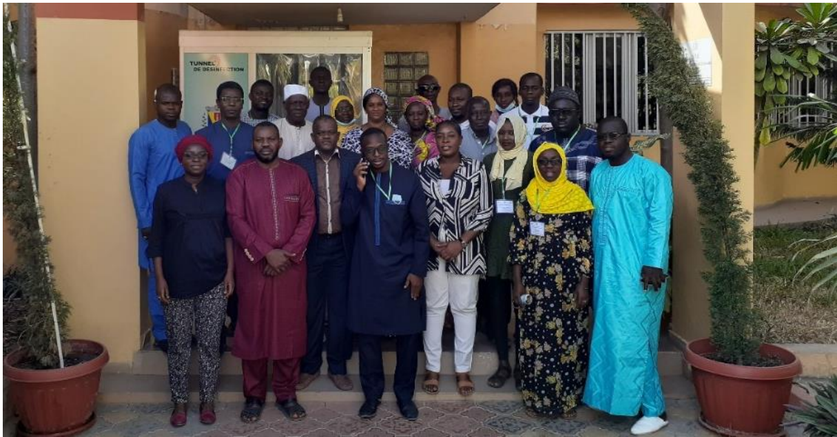
Illustration 19 : Photo de famille formation des agents techniques et acteurs locaux de la ville de Dakar et de la commune de Grand-Yoff

Les objectifs de la tenue de ces sessions de formation étaient de :