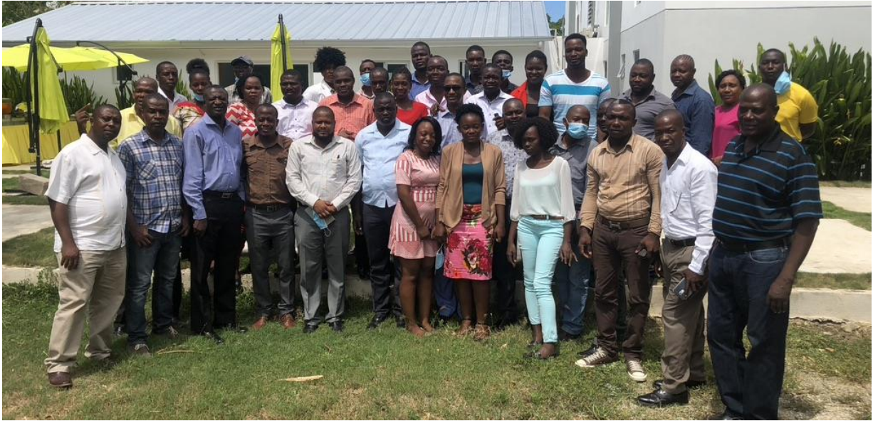
Illustration 18 : Session de Formation des Facilitateurs et Cadres Municipaux au Budget Participatif – Haiti