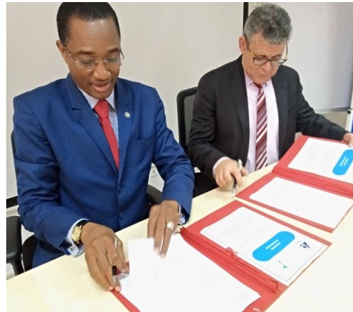
Illustration 17 : Signature de la convention de partenariat entre le CFAD et enda ECOPOP

La session de clôture a été l'occasion pour le Coordinateur Exécutif de Enda ECOPOP et le Directeur Général du CFAD de procéder à la signature de la convention de partenariat, permettant aux deux institutions de conjuguer leurs efforts pour le renforcement des capacités d'accompagnement de la décentralisation dans les domaines de la formation et la mise en réseau sur différents thèmes en lien avec la décentralisation, la gouvernance, le développement local et la domestication des ODD.