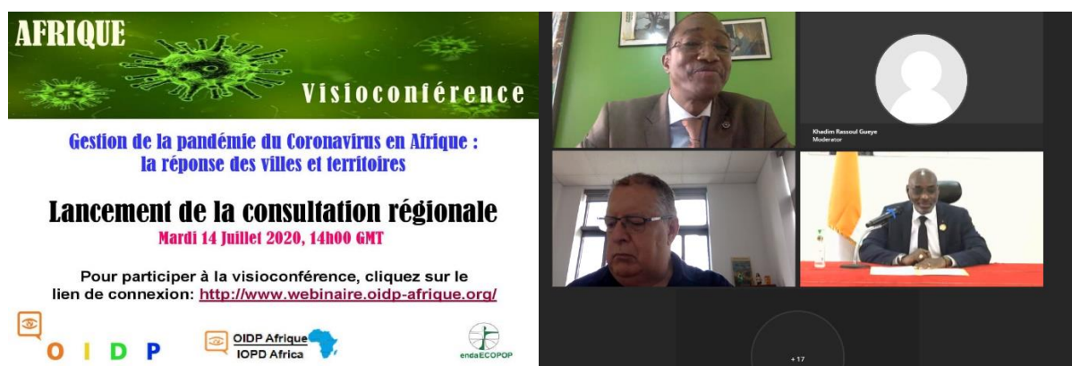
Illustration 8 : Session de Lancement des Consultations COVID – OIDP Afrique

Grâce à cette approche, les représentants de 18 pays d'Afrique ont échangé lors des webinaires sur le contexte d'éclatement de la pandémie dans leurs pays respectifs, son évolution et les mesures qui ont été prises par le gouvernement central et les gouvernements locaux. Ces pays ont également partagé les impacts de la pandémie (sur l'économie locale, la démocratie, la participation citoyenne, etc.), et tenté d'identifier des pistes de riposte et de résilience afin de mieux préparer la période post-COVID. En termes d'audience, 369 participants venant de 31 pays d'Afrique et du monde ont pu prendre part et contribuer aux échanges sur l'ensemble des consultations. Pour chaque sous-région, les consultations ont été présidées par le Président de l'OIDP et modérée par le Coordinateur Afrique de l'OIDP. Ces consultations ont vu la participation d'autorités locales, de responsables de l'OIDP et de diverses institutions partenaires, afin de partager leurs expériences de la gestion de la pandémie au niveau des territoires, dans leurs pays respectifs.