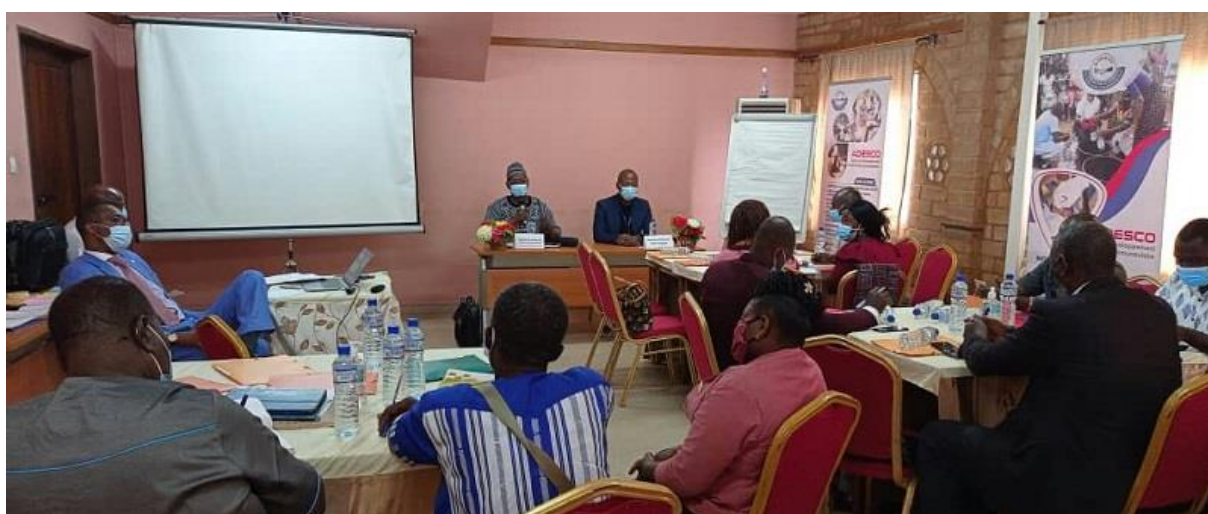
Illustration 10 : Forum National PAGOF - Togo

Cette activité s'inscrit dans la mise en œuvre du projet «Campagne de sensibilisation et de formation pour l'adhésion du Togo au Partenariat pour le Gouvernement Ouvert (PGO)» piloté par l'ONG ADESCO. Le PGO est une initiative internationale multilatérale pour la transparence des gouvernements mise en place en septembre 2011 et regroupant 75 pays dont 9 Etats africains ainsi que des ONG représentant la société civile.